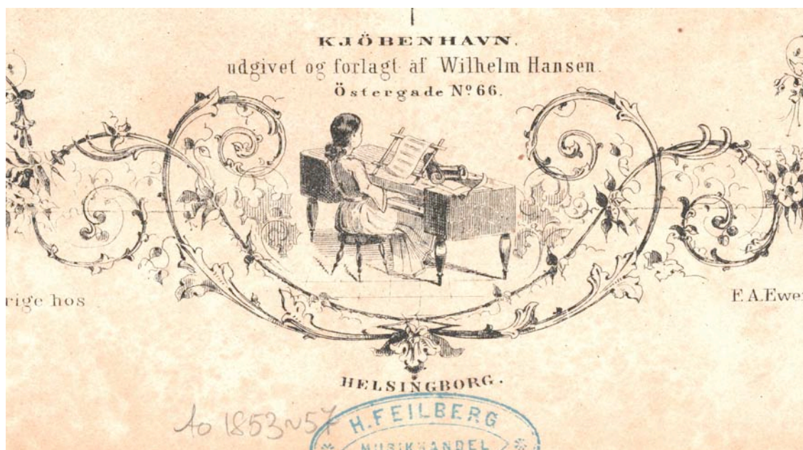
Borgerskapet spiller. Fra noteforside utgitt i København rundt 1865.