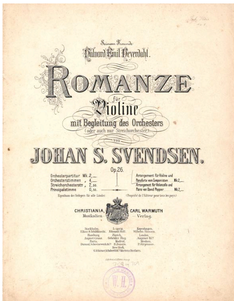
Warmuth-trykk fra oktober 1881: Svendsens Romanse – bestselgeren, her for fiolin og klaver.

Hitlistene og tiårslistene gir svar på spørsmålet om hvilke komponister som til enhver tid var mest ettertraktet gjennom nær hele det 19. århundre og et stykke inn i det neste. Vi ser at Christian Teilman var så populær at han figurerer på hele fem forlags bestselgerlister og var en av de topp-plasserte i hvert tiår fra 1880-årene og fremover; at Ludvig Mathias Lindemans folkevisesamlinger ble store salgssuksesser; at Agathe Backer Grøndahl lå på topp både hos Hals og hos Warmuth og toppet salgslister gjennom to tiår; når hun på listen over Warmuths solgte komposisjoner 1851–82 ikke kommer høyere opp enn på 79. plass og bare har to titler i tillegg på listen (125. og 152. plass), skyldes det simpelthen at hennes blomstringstid falt senere. Kvinnene kommer inn for fullt på 1850-tallet, både på forlagenes hitlister og på tiårsoversiktene. Utenlandske navn utgjør totalt sett ca. 30 %, etter 1860 synker andelen til under 10 %.