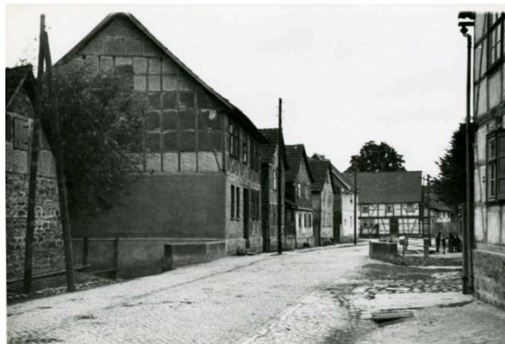
Gården til venstre er barndomshjemmet i Thalebra, foto ca. 1928. Privat eie.