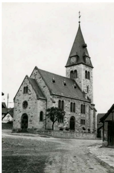
Kirken i Thalebra rundt 1928. Privat eie.