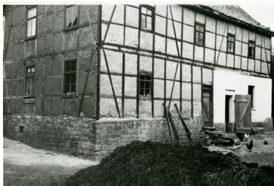
Gården fra østsiden.