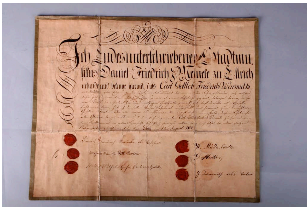
Stadsmusikantattesten, Ringve Museum