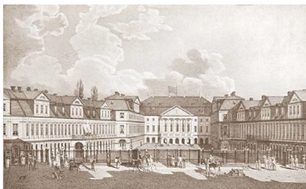
Slottet før brannen i 1830.