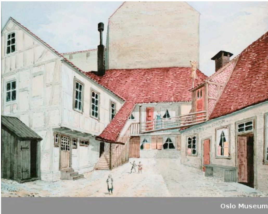
Nedre Vollgate 13, gårdsrommet. Akvarell av Peter Andreas Blix 1898. Oslo Museum.